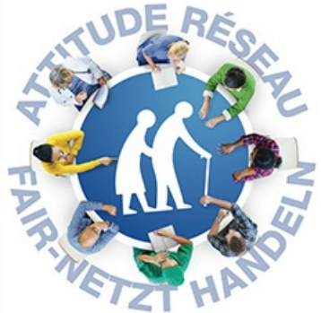
Lauréats Prix Villes Amies des Aînés 2016

L'INTERGÉNÉRATION, UN DÉFI POUR LA COHÉSION SOCIALE