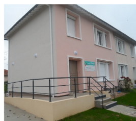
Le Havre La Maison Dahlia